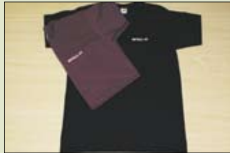
T-paita 9 €