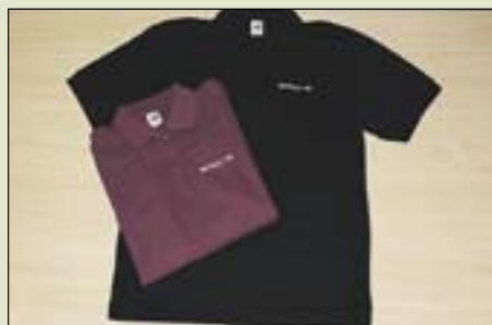
Pikepaita 15 €