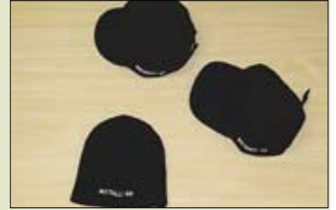
Lippalakki 8 € , Armylakki 8 € , Pipo 9 €