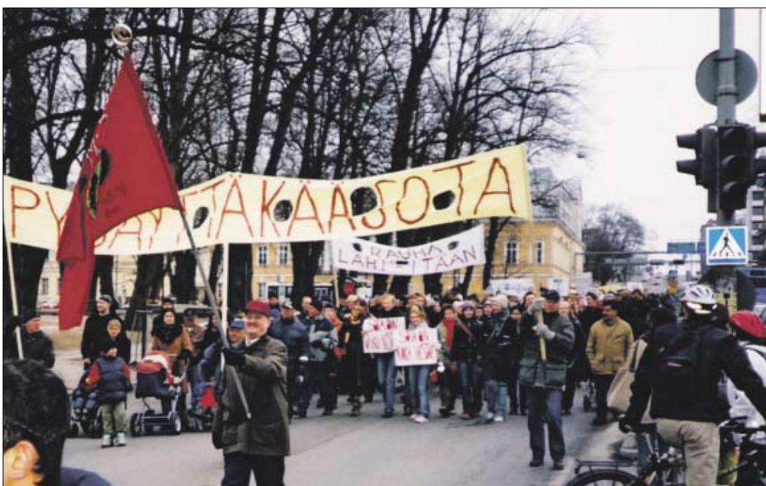
Metalli 49:n saaman palkinnon perusteena oli mm. pitkäaikainen aktiivinen työpaikkatason rauhantyö, yli 20-vuotinen ystävyysoiminta Pietarin Koneenrakentajien kanssa sekä osaston toiminta rauhanliikkeessä, lukuisien mielenosoitusten ja tilaisuuksien järjestäjänä.