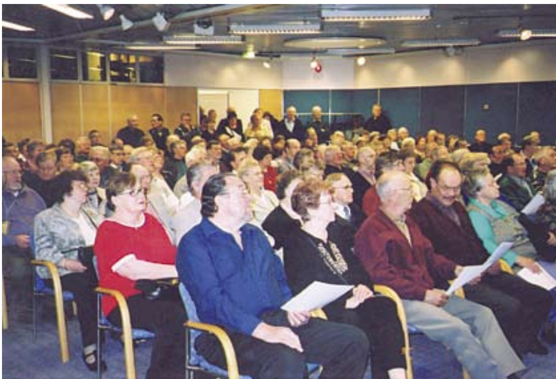
Veteraanien syysristeilyllä 28.9.-29.9., mielenkiintoiset alustajat ja suosittu Metallishow .