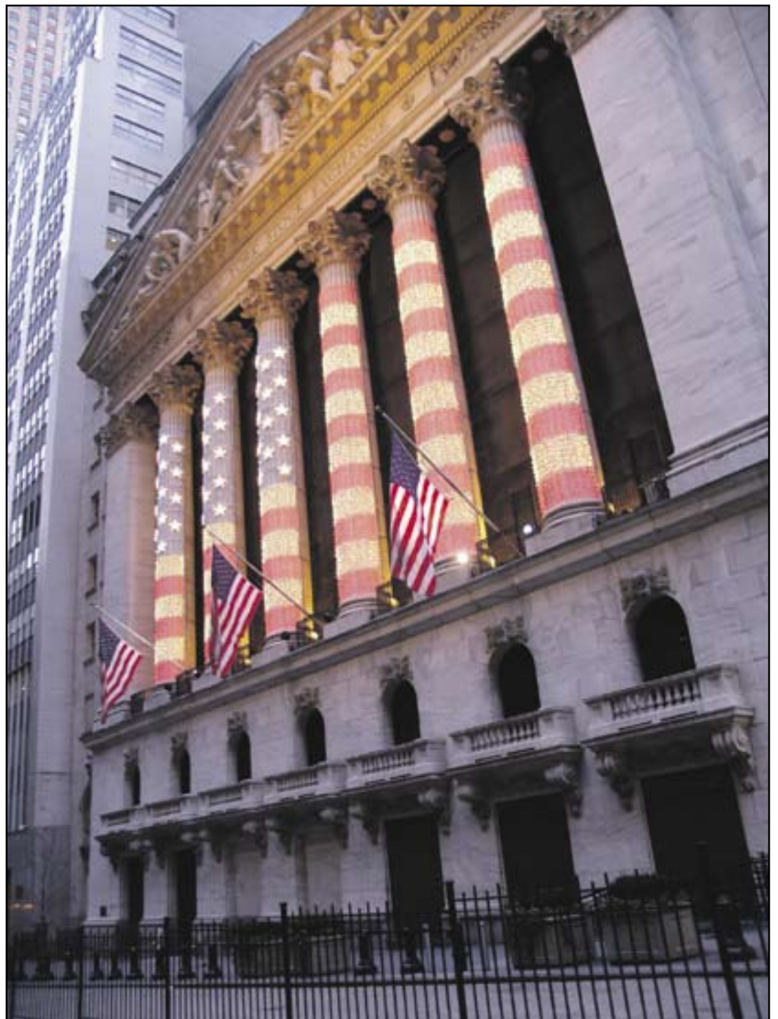
New Yorkin pörssin julkisivu rahamaailman keskuksessa Wall Streetillä.

Teksti: Johannes Yrttiaho Seppänen, Esko: Hullun rahan tauti. Kapitalismin musta syksy. Huutomerkki 1/09. Tammi 2009. 192 sivua