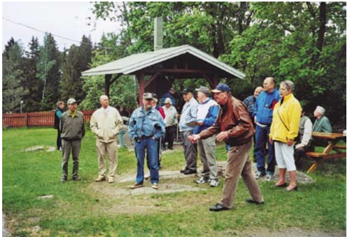
ke 3.6. klo 12.00 veteraanipäivä Ali-Kirjalassa. Kutsuvieraana os. 6 Porin ja os. 23 Loimaan veteraanit.

Esillä on veteraanien hyvinvointiin liittyvä tai muuten kiinnostava aihe.