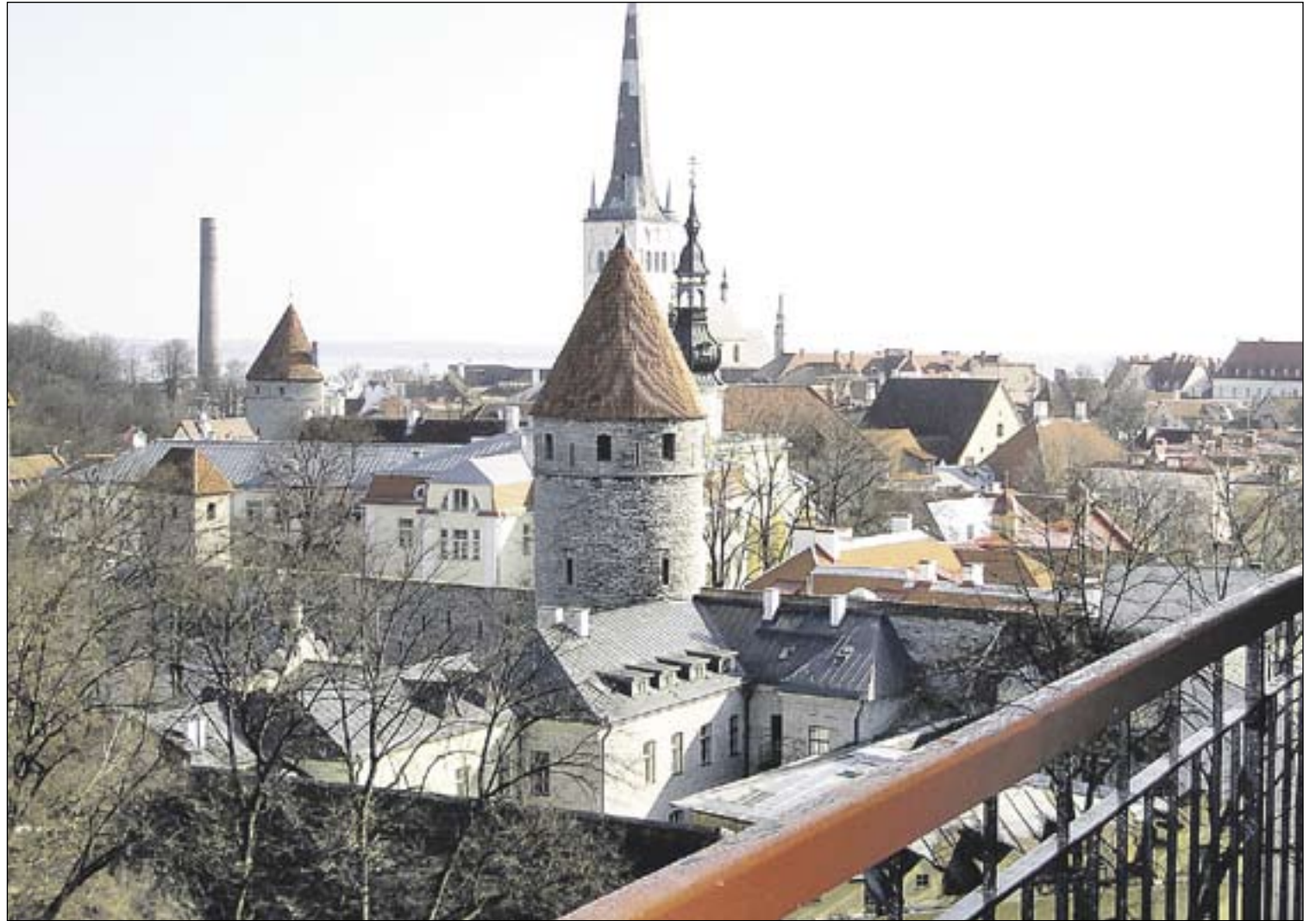
Sunnuntaiaamupäivä kului Tallinnan kauniissa vanhassa kaupungissa. Keskiaikaisten rakennusten ympäröimällä Raatihuoneen torilla nautittiin keväturingosta ja terrassitunnelmasta.

Eduskunnassa pidetyn koulutuksen ja esittelykierroksen jälkeen nuorisajaosto tapasi Metallin os. 5:n nuorten edustajia läheisessä ravintola Manalassa. Metallin 49:n nuorisajaosto esitti vitoslaisille vierailukutsun osaston kesäpaikkaan Paraisten