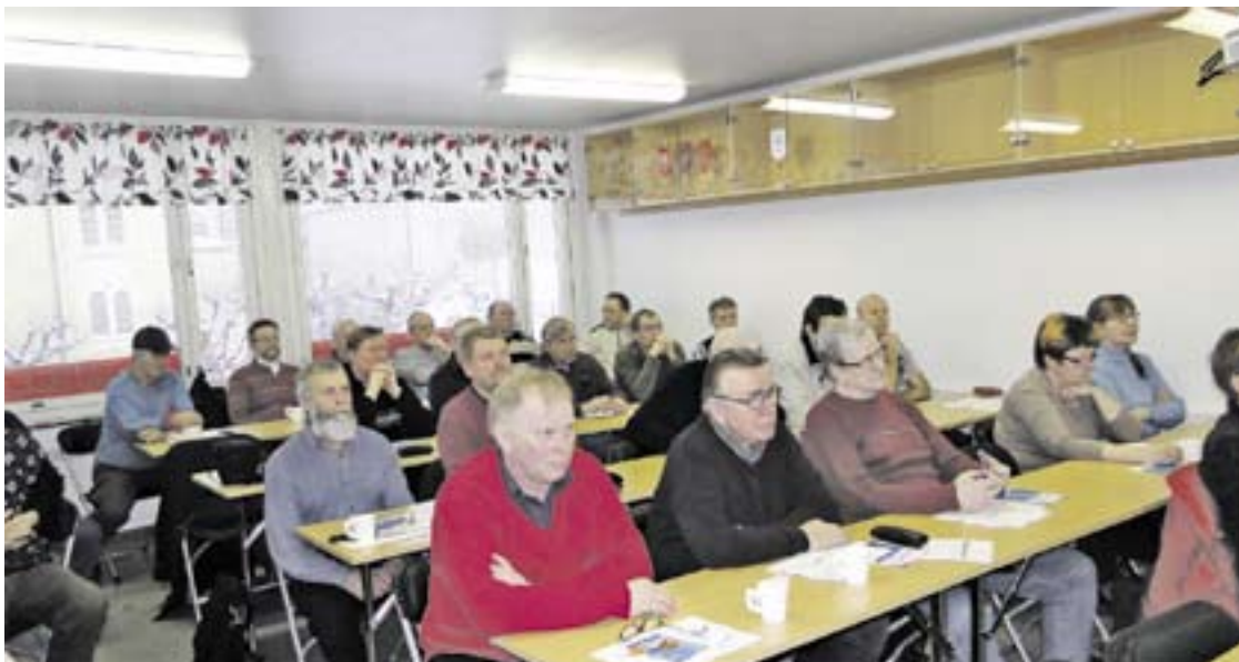
Veteraanijaosto on jo muutaman vuoden ajan järjestänyt eläketiedotustilaisuuksia, jotka ovat saavuttaneet suuren suosion.

Veteraanijaosto on jo muutamien vuoden ajan järjestänyt eläketiedotustilaisuuksia, jotka ovat saavuttaneet suuren suosion. Tämän kevään eläketilaisuudet pidettiin 16.3. ja 8.4.