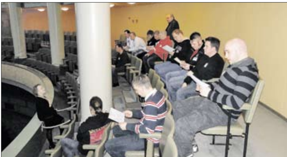
Metalli 49:n nuorisajaosto vieraili kevätretkellään mm. eduskunnassa.